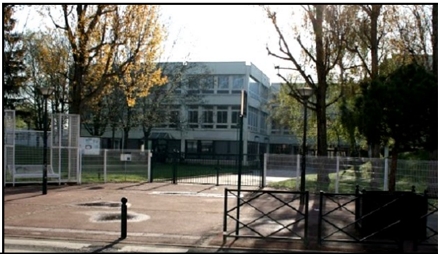
Collège la Fosse aux Dames